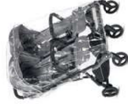
Paneggiaggio per Twin Sketch Rain Cover for Twin Sketch