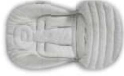
Baby Snugg Pad - Cascino Riduttore per Passaggio Baby Snugg Pad - Stroller Adapter