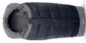
Sacco invernale Passaggio Scopri tutte le varianti a pagina 108 Stroller Winter Bag Discover the colour range on page 108