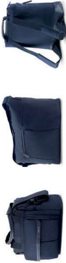
Borse Scopri i modelli e i colori a pagina 100 Bags Discover the colour range on page 100